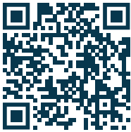
TABLAS DE ELEGIBILIDAD DE INGRESOS

Los ingresos familiares no deben exceder los límites de ingresos establecidos.